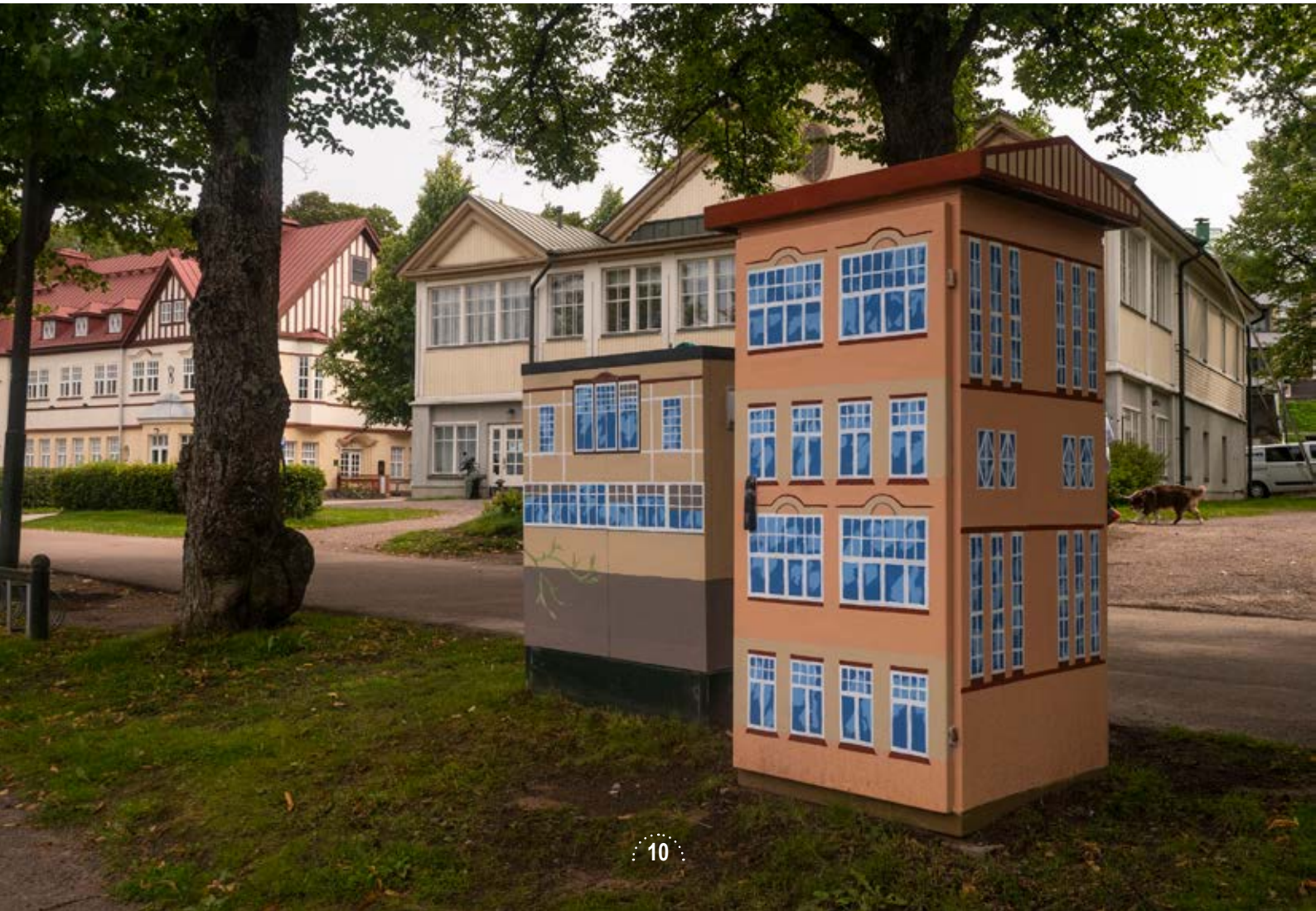
Anni-Sofia Knuutilan jakokaappiteos suihkulähteen ohjauskaapeissa Kasinonrannassa