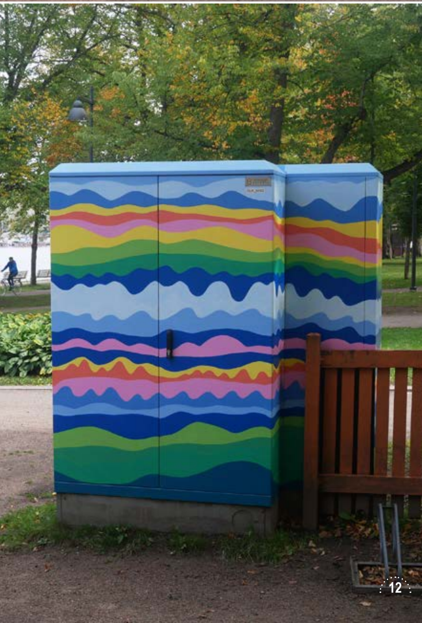
Viivi Kiiskisen maalaama jakokaappi Rantapuiston leikkikentän vierellä.