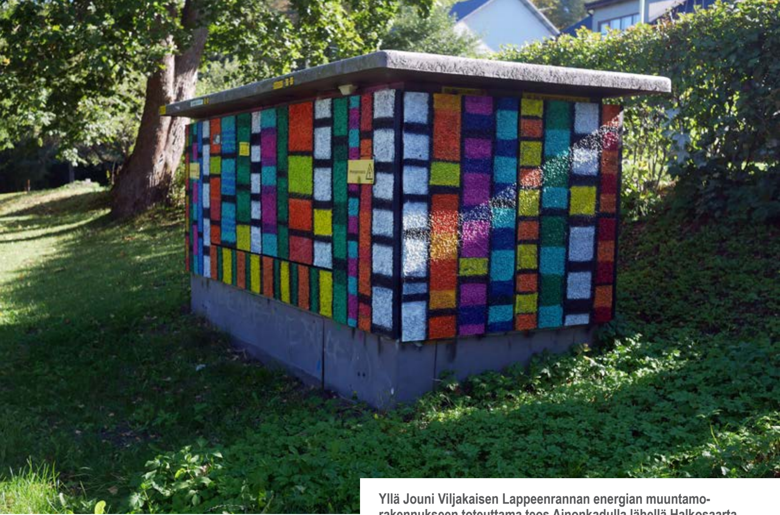
Yllä Jouni Viljakaisen Lappeenrannan energian muuntamoraennukseen toteuttama teos Aionkadulla lähellä Halkosaarta. Alla osa Veera Metson muuntamoteosta Myllysaassa.