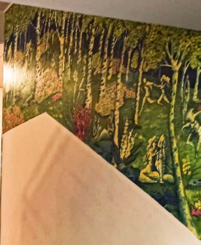
Essi Pitkänen maalasi teoksen "Juhlat Koivikossa" Lappeenrannan opiskelija-asuntosäätiön kerrostalon rappukäytävään Skinnarilassa.