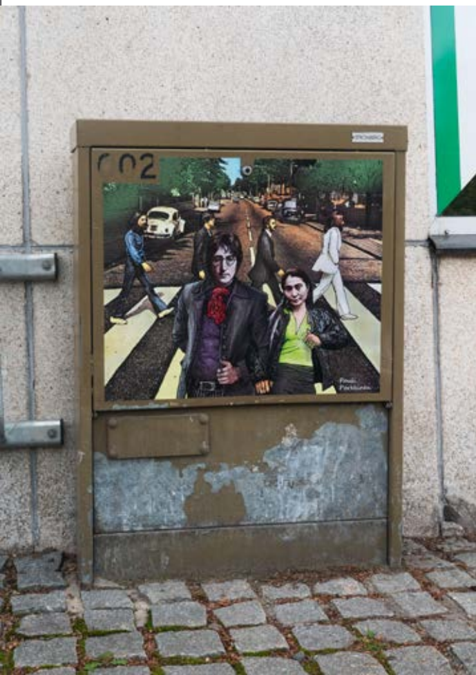
Saara Reinikaisen maalaus Itsenäisyydenkadulla Lauritsalassa.