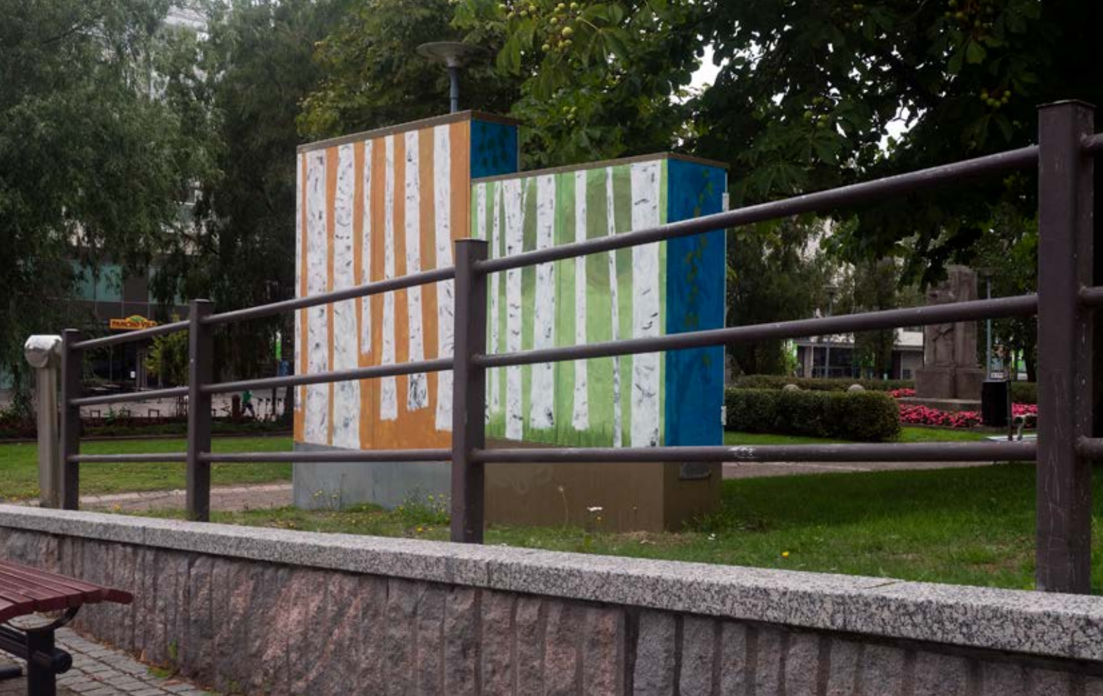
Jouko Lempinen maalasi jakokaappeja Keskuspuistossa, tässä kuva Kauppakadun puolelta.