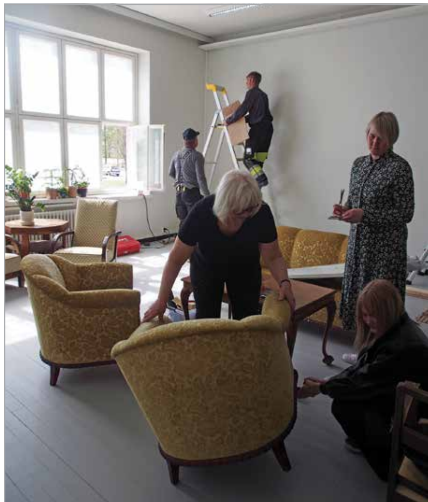
Galleria Koria rakentumassa Kouvolan asuntomessuille.

TTT-hankkeelle ja erityisesti Galleria Korialle haettiin omarahoitusosuutta alueen rahastoilta (SKRn Etelä-Karjalan ja Kymenlaakson rahastot, Ekps Säätiö) mutta kaikilta saatiin kielteinen päätös. Kaakon taide päätti kuitenkin hallituksen kokouksessaan toteuttaa hankkeen sen merkittävyyden vuoksi. Lisäksi Etelä-Karjalan Taiteilijaseura ja Korutaideyhdistys lupautuivat osarahoittamaan hanketta. Koura ry sitoutui rahoituksen sijasta osallistumaan hankkeeseen suuremmalla työpanoksella.