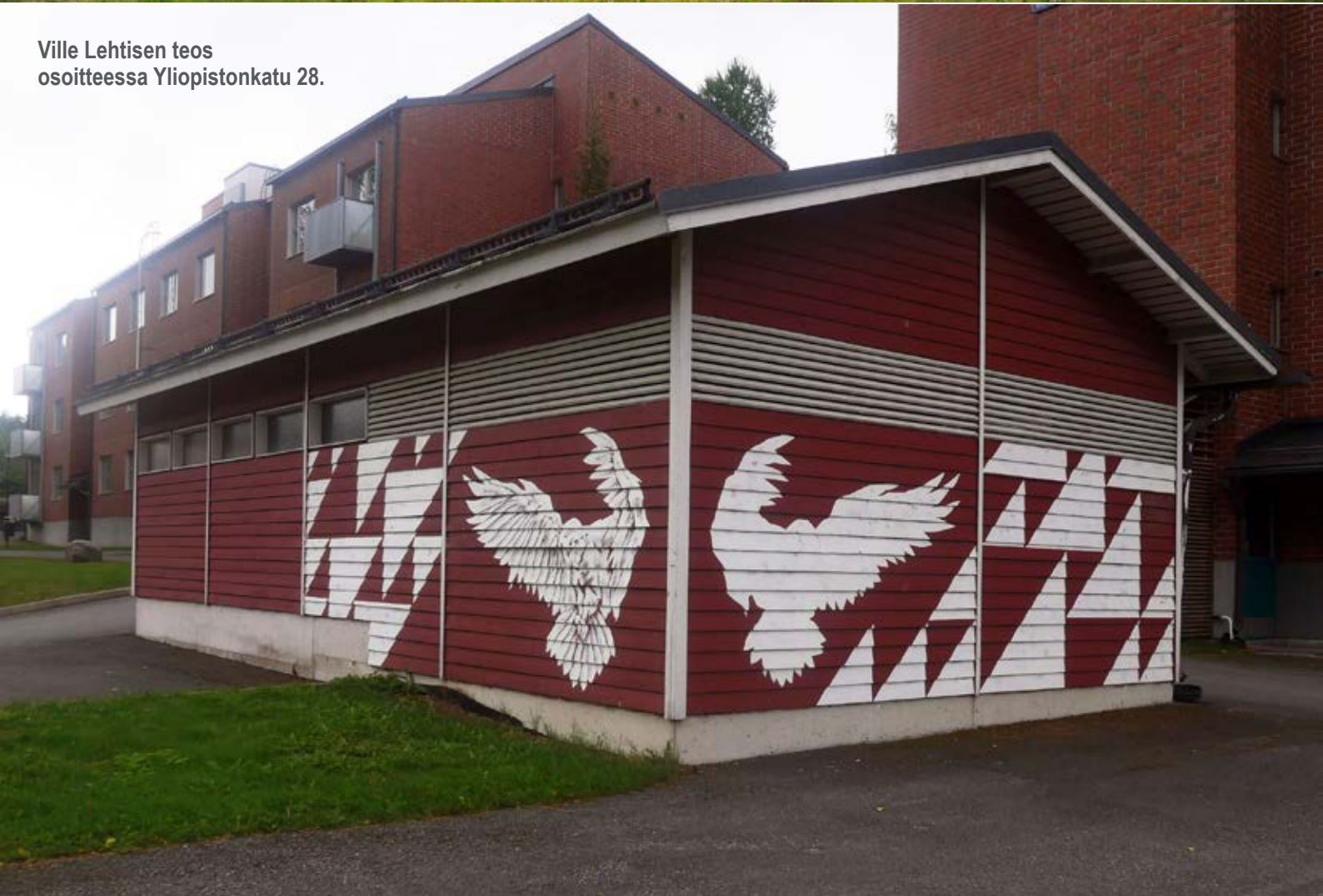
Ville Lehtisen teos osoitteessa Yliopistonkatu 28.